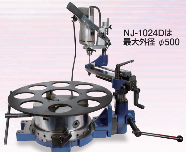
NJ-1024Dは 最大外径 φ500